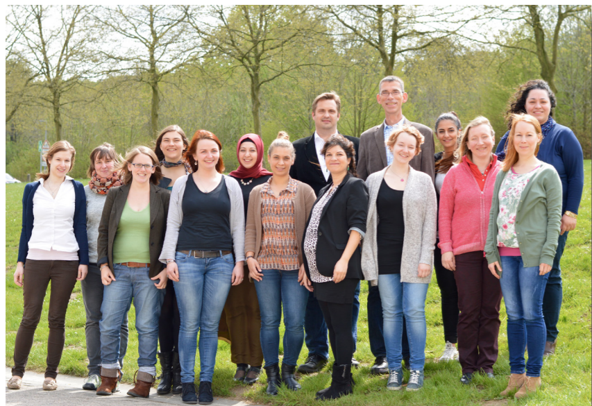
BaBi-projesi çalışma grubu

BaBi-çalışma grubumuz; Bielefeld Üniversitenin Sağlık Bilimleri Fakültesi'nde çalışmakta olan araştırmacılardan oluşmaktadır. Biz, Bielefeld'de bulunan kadın doğum kliniklerin yanı sıra, kadın doğum uzmanları, çocuk doktorları ve ebeler ile işbirliği yapmaktayız.