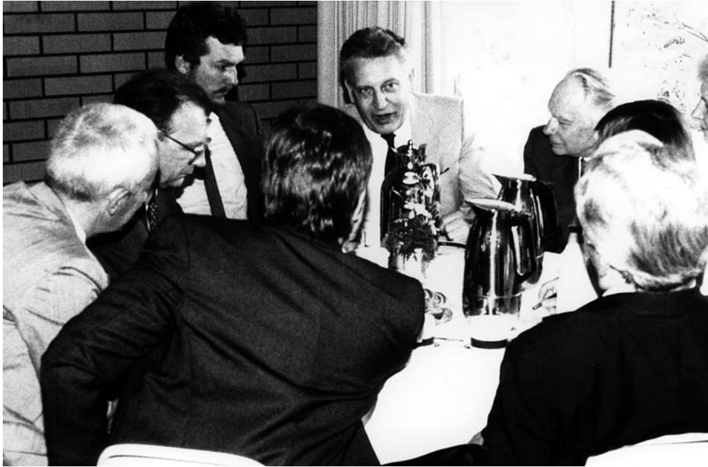
Besuch von Ministerpräsident Lothar Späth in Oberwolfach 1984