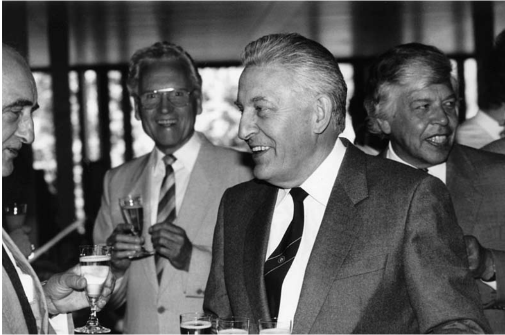
Einweihung der Erweiterung des Gästehauses 1989